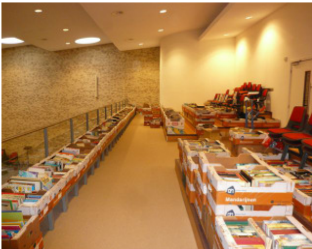
Boeken werden 15 oktober op het balkon verkocht

Woensdag 9 november is er weer een mini-bazaar. U mag dan ook spulletjes inleveren voor deze activiteit, die dit jaar nog op 23 november, 7 december en 21 december zal plaatsvinden.