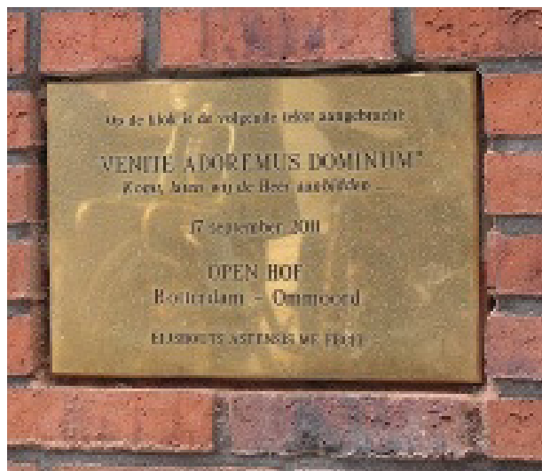
De gegevens van onze klok, die op 5 juli 2011 werd gegoten. Zoals vermeld op de plaquette geplaatst op de sokkel van de klokkestoel.