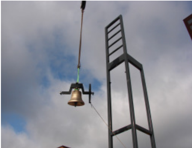
De klok op weg naar zijn bestemming.