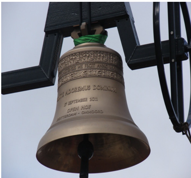
van boven naar beneden:

Afbeelding van Maria, Jozef en kindje Jesus en de drie wijzen/magiërs/koningen, die de ster gevolgd hebben.