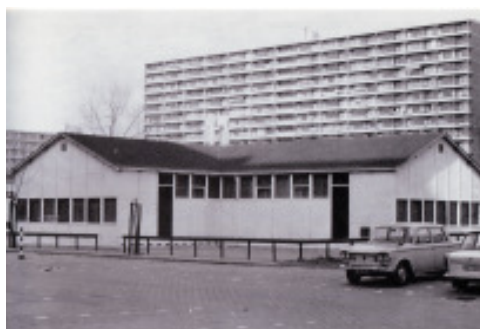
de noodkerk uit de jaren zestig