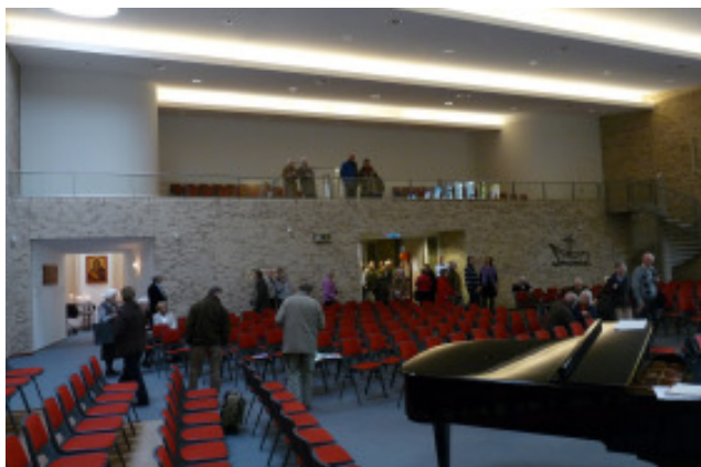
De kerkzaal heeft veel belanstelling