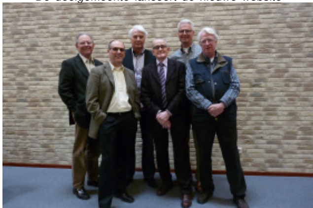
Een terecht trotse bouwcommissie