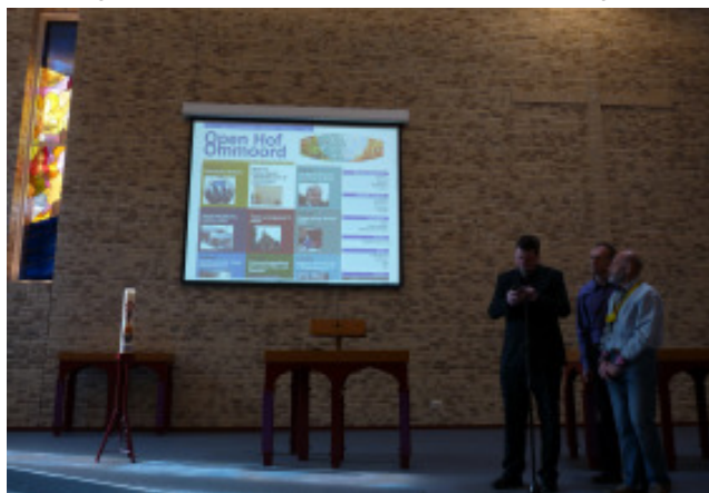
De deelgemeente lanceert de nieuwe website