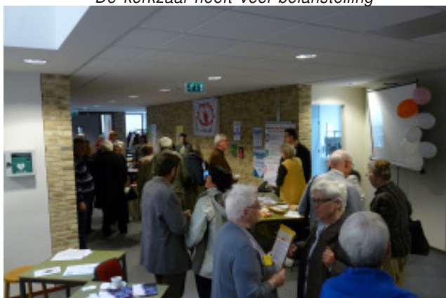
De gasten worden met enthousiasme ontvangen