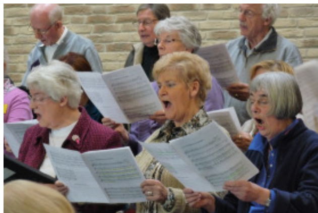
Er wordt vol overgave gezongen!